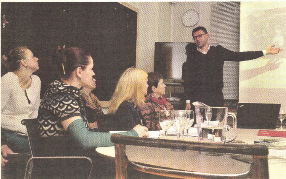
Šogad konkursa finālā iekļuvuši visdažādāko nozaru uzņēmumi, un to pārstāvēniecība bija raiba kā dzeņa vēders..

Latvijā atkritumu pārstrādāšana un šķirošana ir zemā līmenī, tirgū nav pietiekami daudz izejmateriālu, kurus varētu nodot otrreizējai pārstrādei. Jau vairākus gadus šajā jautājumā nav vienotas valsts virzības, cilvēkiem nav skaidrs, kādus atkritumus ir vērts šķirot. Valstī ir izstrādāta atkritumu apsaimniekošanas stratēģija un plāni, bet tie tā arī ir palikuši uz papīra, netiek aktīvi realizēti. Ja tiktu savākti vairāk pārstrādei derīgu atkritumu, Latvijas ražotājiem būtu plašākas iespējas no vietējiem izejmateriāliem radīt jaunus produktus. Mūsu ražotāji var būt konkurētspējīgi pasaules tirgū, jo inovācijas vienmēr tiek novērtētas.